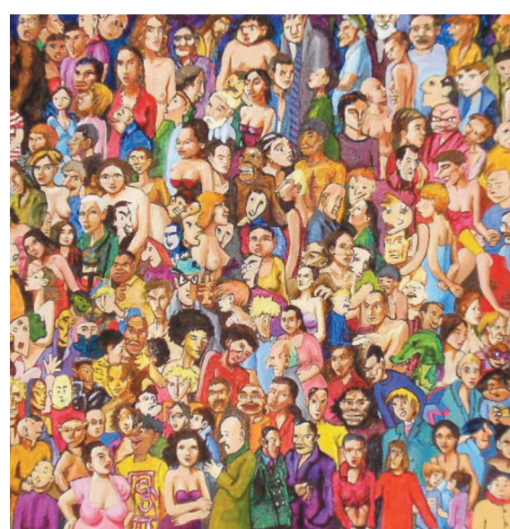
Immagini Una folla multicolorata