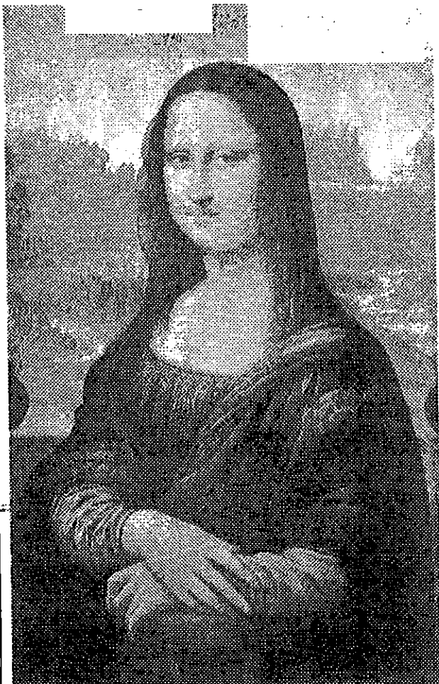
M. Duchamp, L.H.O.O.Q., più nota come Gioconda con i baffi

M entre si annuncia un convegno internazionale, che riunirà il Gotha della filosofia a Bonn per discutere della necessità di un New Realism (dopo anni di ammorbante Pensiero debole), anche in Italia si accende il dibattito sulla proposta lanciata dal filosofo Maurizio Ferraris. Il docente dell'Università di Torino sabato 17 settembre (ore 11,30) ne parlerà in una lectio magistralis , in piazza a Carpi nell'ambito del Festival filosofia di Modena. Ad ottobre, poi, uscirà per i tipi di Guanda il suo nuovo libro L'anima e l'iPad . Professor Ferraris, Pensiero debole e Postmoderno hanno imperversato per anni. Con quale danno? I danni sono venuti soprattutto attraverso il populismo, che ha ricevuto un potente anche se in buona parte involontario fiancheggiamento ideologico da parte del Postmoderno. E