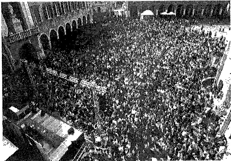
Modena, la passata edizione di Festivalfilosofia

Derubricare l'adesione al nazismo di Heidegger a scelta privata è lecito? O bisogna aprire gli occhi su quello che molti maestri del '68 e teorici del pensiero debole non hanno voluto vedere: ovvero che il pensiero stesso di Heidegger è nazista? E perché i filosofi non hanno voluto, irresponsabilmente, vedere questa pericolosa consustanzialità?