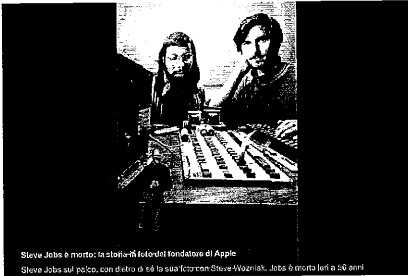
Steve Jobs è morto: la storia in foto del fondatore di Apple