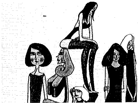
Filosofia per dame: particolare del libro di Ferraris

Il matrimonio, il lavoro, il licenziamento. E ancora le vacanze, la suocera, la sfiga. Di dizionari, in giro, ve ne sono di ogni. Ma questa Filosofia per dame che Guanda ha pubblicato di recente stupisce e diverte per più di una ragione.