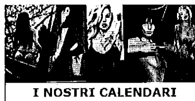
FOTO PIÙ BELLE DELLA SETTIMANA