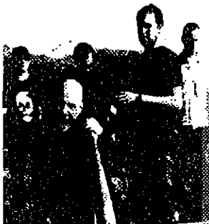
La band scozzese